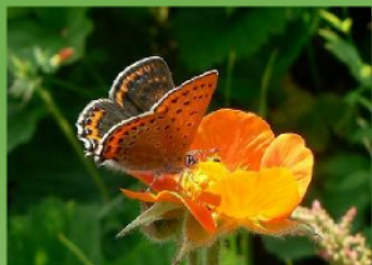
Пакленац ( Lycaena helle )