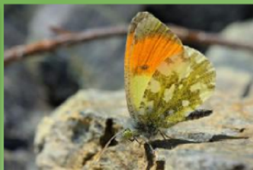
Мала зорица ( Antocharis gruneri )