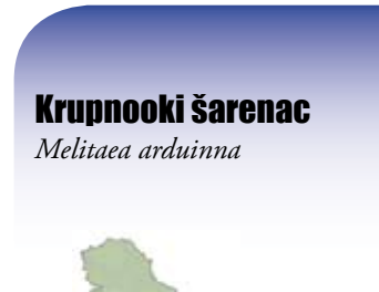
Krupnooki šarenac Melitaea arduinna

Polja sa crnim tačkama obostrano konkavna.