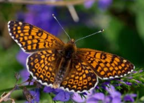
Crnooki šarenac Melitaea cinxia